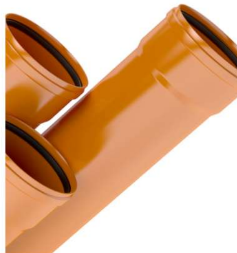
PVC da tubi